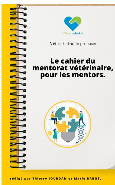
CAHIER DU MENTORS (VETOS-ENTRAIDE.COM)

Après une rapide définition de ce qu'est le mentorat, la précision de ce qu'il n'est pas, un aperçu de ce qu'une relation mentorale peut apporter aux deux protagonistes de l'équipe, ces cahiers viennent retracer les étapes importantes de la construction de ce lien particulier et ce qui en fait la qualité : l'écoute bienveillante, la confidentialité, la confiance et le respect mutuel, le bénévolat en sont des piliers indispensables.